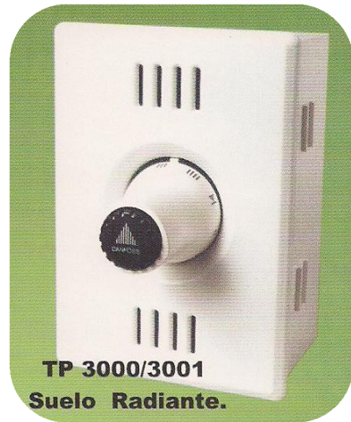
TP 3000/3001 Suelo Radiante.