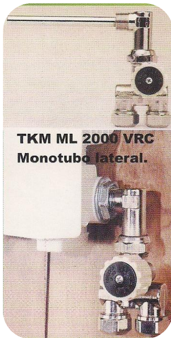
TKM ML 2000 VRC Monotubo lateral.