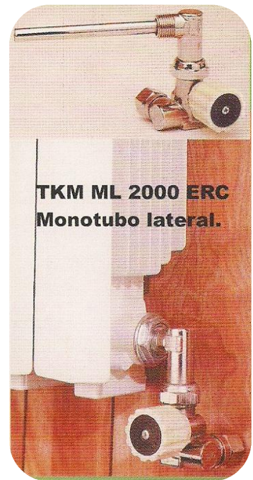
TKM ML 2000 ERC Monotubo lateral.