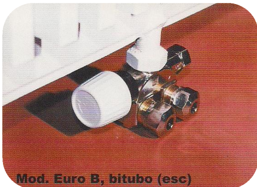
Mod. Euro B, bitubo (esc)