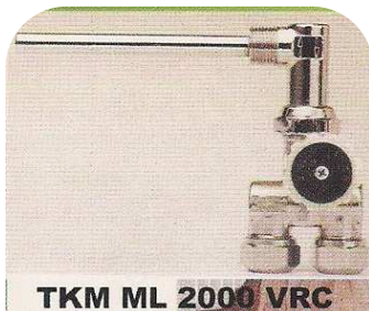
TKM ML 2000 VRC Einrohr seitlich