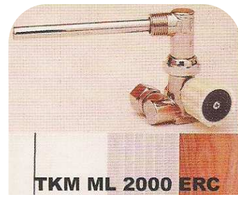
TKM ML 2000 ERC Einrohr seitlich