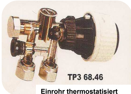
TP3 68.46 Einrohr thermostatisiert