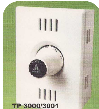
TP 3000/3001 Einzelraumregelung für FBH